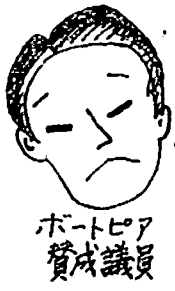
ポトピア賛成議員

・あの署名は重複して喜んだり...暴力団が来るとおどし集めたり... ・過半数の署名でも真の民意ではない。 ・～請願の提出自体に反対する。