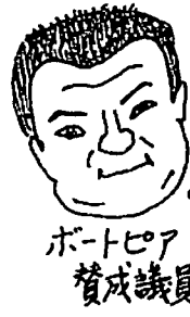
ポトピア賛成議員

・あの署名は重複して喜んだり...暴力団が来るとおどし集めたり... ・過半数の署名でも真の民意ではない。 ・～請願の提出自体に反対する。